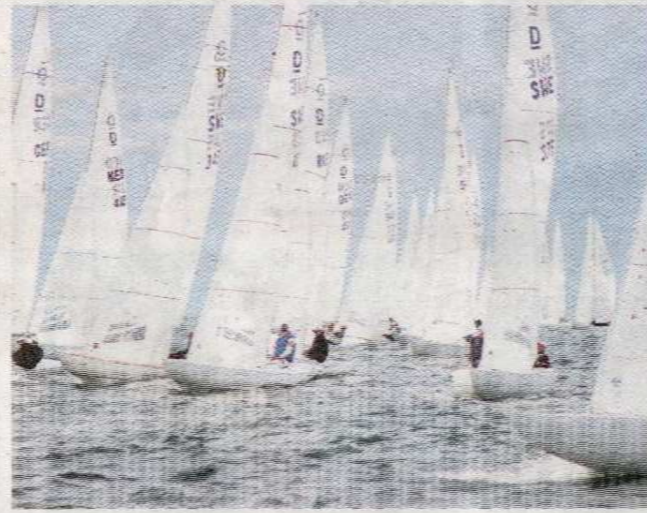
Helgen innan Dragon Gold Cup har SM i drakbåt avgjorts i Marstrand.

– Marstrand är ett av topp fem ställen att segla på i världen. Sen har vi bebyggelsen