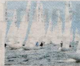
Dragon Gold Cup har under veckan seglats utanför Marstrand, men tävlingarna blev försenade efter att vinden ställt till det.