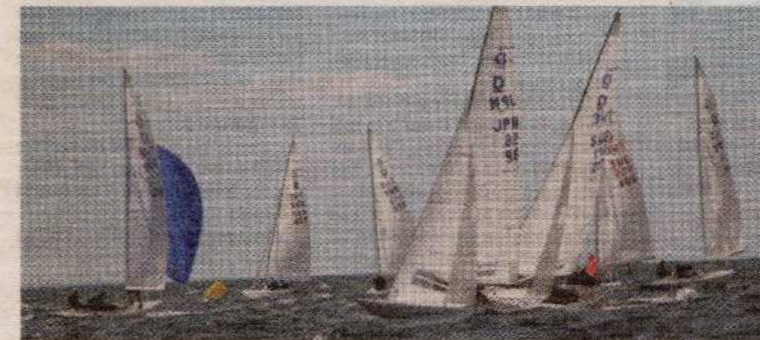
Under onsdagen kunde drakbåtarna till slut ge sig ut på vattnet utanför Marstrand.